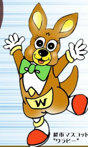
蕨市マスコットキャラクター "ワラビー"