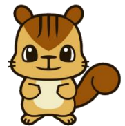
川エイメージキャラクター かわリス君

入学許可候補者には、平成29年3月24日（金）午後 に当校において保護者同伴で行う。